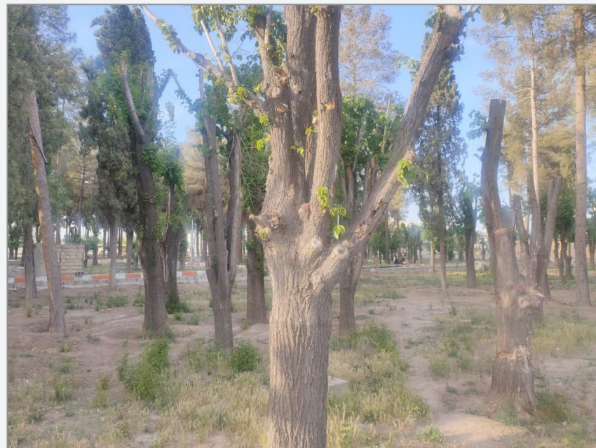
وضعیت اسف بار درختان پارک فردوسی (۱۷ شهریور)

https://rubika.ir/nasim-omidirjan eitaa.com/nasimomidirjan