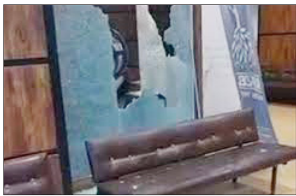
دوران انتشار لحظه‌ای خبرها خیلی مهم‌تر از اصل خبر است. به نکته‌ای در خبرها که باید دقت کرد این است که کنسرت موسیقی مختص خانواده‌های کارکنان شرکت توسعه آهن و فولاد گل‌گهر بوده

است! تبعیض همین جاست. اینکه شرکت‌های معدنی با اختلاف حقوق‌های بالا نسبت به حقوق پایه اعلامی اداره کار، نه تنها موجب بروز اختلاف طبقاتی و عمیق‌تر شدن شکاف پولدار و فقیر در سیرجان شده‌اند که حالا این شکاف دارد خود را در بهره‌مندی از دیگر امکانات تفریحی و فرهنگی هم نشان می‌دهد و میان شهروندان سیرجانی تبعیض را عادی جلوه می‌دهد. اگر قرار به برگزاری کنسرت در این شهر است، چرا عمومی برگزار نشود؟ چرا مختص خانواده‌های کارکنان معدنی باشد؟ مگر خون آن‌ها از خون بقیه رنگین‌تر است؟ پس عدالت اجتماعی در استفاده از امکانات فرهنگی کجا رفته؟ اگر قرار است موسیقی زنده اجرا شود، باید امکان خرید بلیط و حضور برای همه همشهریان سیرجانی فراهم باشد. شرکت‌های معدنی چگونه رویشان می‌شود کنسرت موسیقی برگزار کنند آن هم به طور اختصاصی! بعد هم احتمالاً اگر این اتفاق نیفتاده بود نیز با کلی تبلیغات برگزاری این کنسرت را به مسئولیت اجتماعی‌اش در قبال سیرجان معرفی می‌کردند و مردم خوش‌باور ما هم باورش‌مان می‌شد.