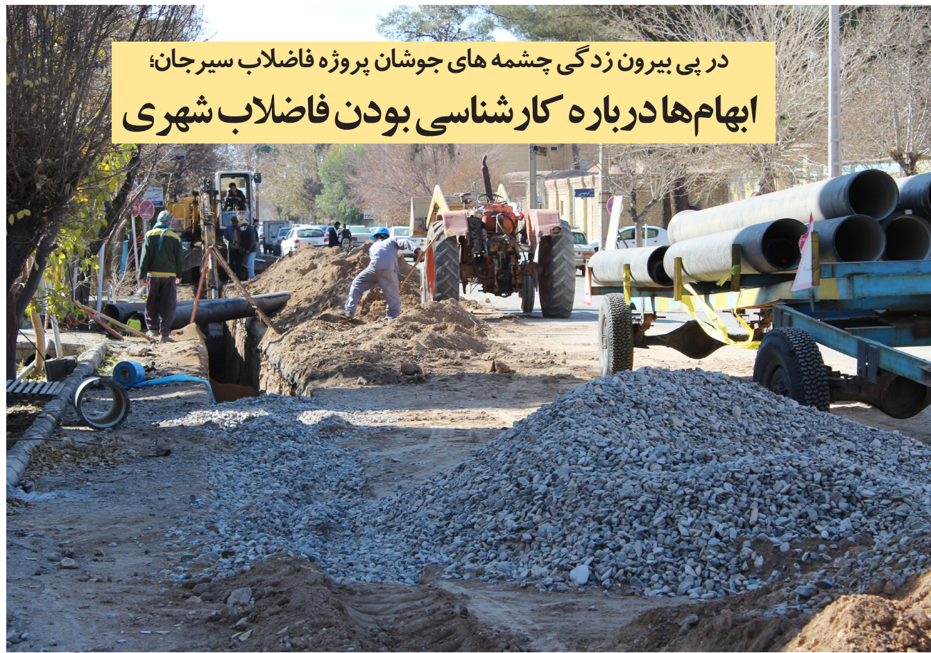
در پی بیرون زدگی چشمه‌های جوشان پروژه فاضلاب سیرجان؛ ابهام‌ها درباره کارشناسی بودن فاضلاب شهری