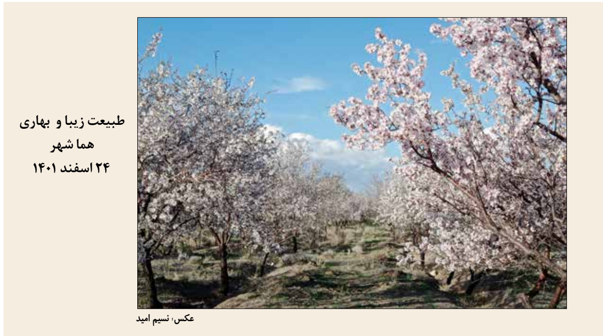
طبیعت زیبا و بهاری هما شهر ۲۴ اسفند ۱۴۰۱

گستره توزیع: استان کرمان مدیر مسئول: ۹۱۳۳۴۷۰۷۲۸ تبلیغات: ۰۹۱۳۳۹۴۵۰۰۹۶ چاپ: مهدوی نشریه در ویرایش مطالب ارسالی آزاد است "نسیم امید" یک گفتمان است www.nasim-omid.ir