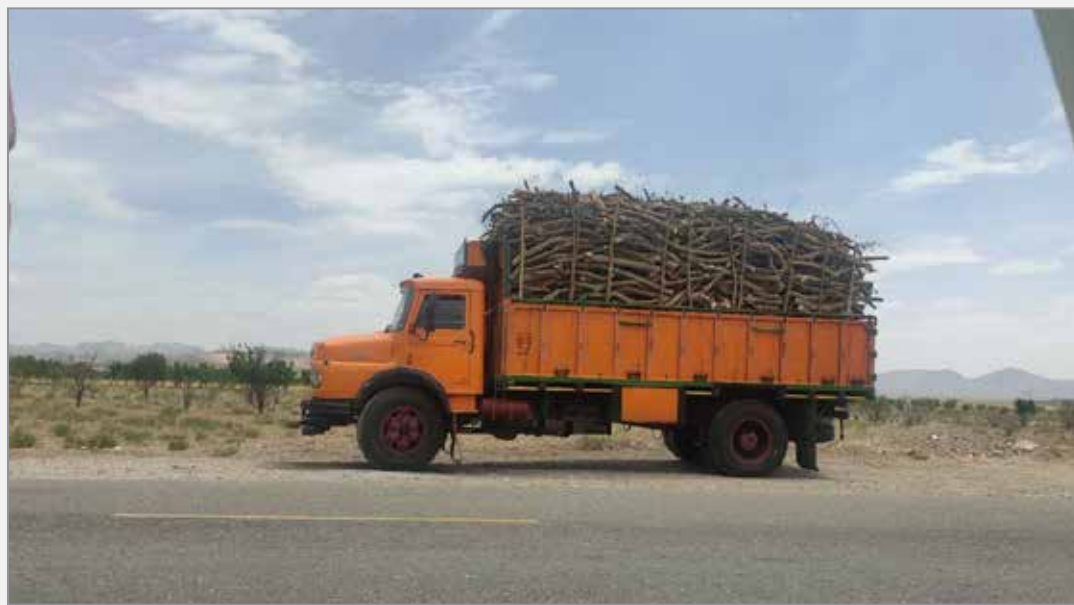
کامیون های چوب بی شمار در جاده بافت- سیرجان (از شهرستان جیرفت) عدم نظارت مسئولان بر قاچاق چوب

https://rubika.ir/nasim-omidsirjan eitaa.com/nasimomidsirjan