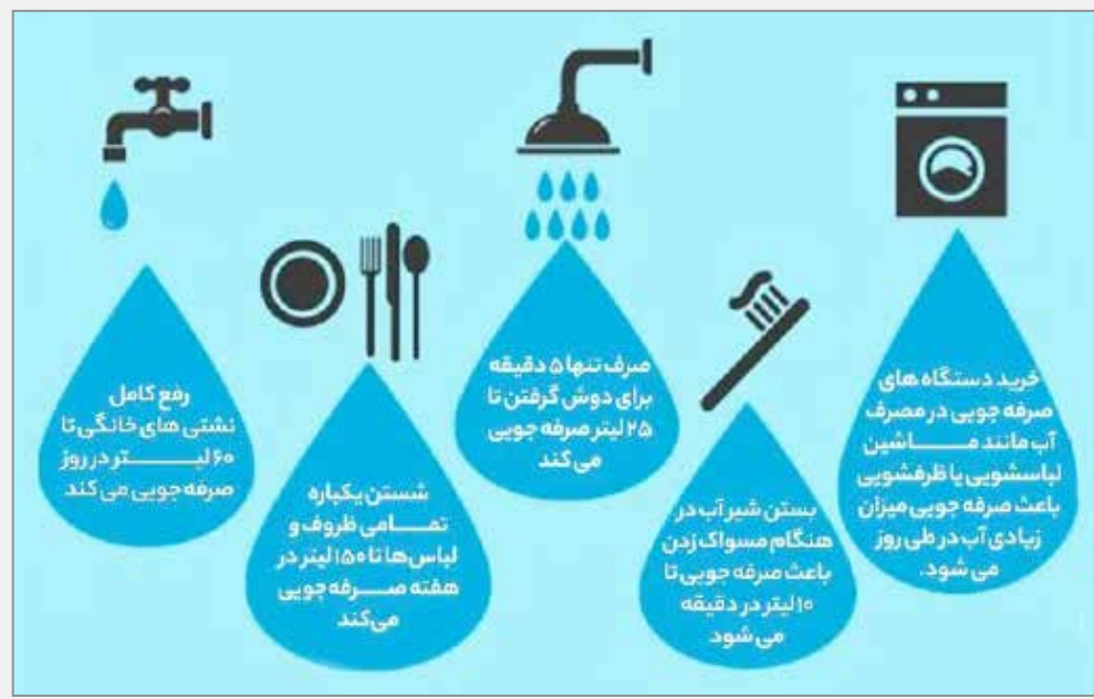
صرفه جویی در مصرف آب خانگی

او افزود: از آنجا که در حال حاضر در جامعه ما مشکلات اقتصادی و معیشتی یکی از بزرگ‌ترین علل ازدواج‌های دیر هنگام و بسیاری از معضلات اجتماعی است، جا دارد مسئولین مرتبط به منظور برطرف کردن این نقیصه مهم و فراهم آوردن بستری مناسب با آموزش تئوری و عملی خانواده‌ها و برنامه‌ریزی دقیق و هماهنگ با دولت به منظور تغییر شرایط مالی و اقتصادی و شغلی جوانان، آنان را تشویق به انجام به موقع این نیاز بشری که بدون تردید طی چند نسل اجتماعی سالم و به دور از انحرافات رایج را به دنبال خواهد داشت، کوشا باشند.