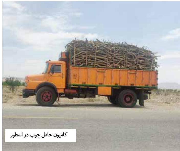
کامیون حامل چوب در اسطور