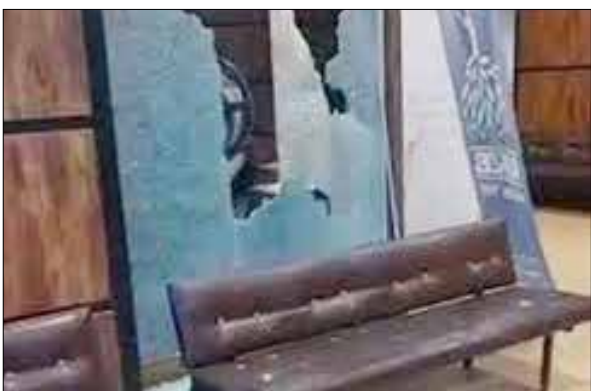
دوران انتشار لحظه‌ای خبرها خیلی مهم‌تر از اصل خبر است. به نکته‌ای در خبرها که باید دقت کرد این است که کنسرت موسیقی مختص خانواده‌های کارکنان شرکت توسعه آهن و فولاد گل‌گهر بوده