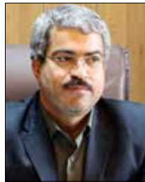
پیگیری لازم در این باره انجام می‌شود

گفتنی است بیمارستان قدیم امام رضا علیه السلام توسط مرحوم دکتر صادقی برای خدمات درمانی برای عموم بالاخص شهروندان محروم و مستضعف این مناطق وقف شده است و به نظر می‌رسد با اقدامات انجام شده از اهداف واقف دور شده است که می‌تواند مسئولان فعلی دانشگاه علوم پزشکی و آستان قدس اقدام لازم را در این باره انجام دهند.