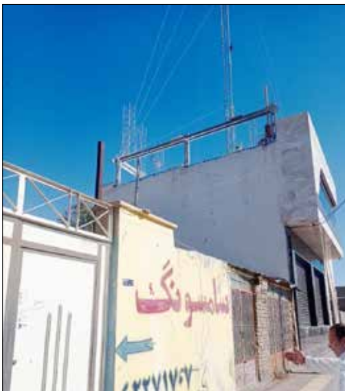
تأمین اصولا در کارهای شخصی دکل کار شخصی است و شورای تامین در مسائل مهم امنیتی و...